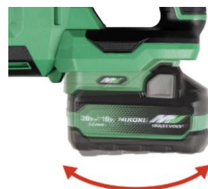
振動にも強い振り子構造。

振動を吸収する電池防振構造により、電池接合部への負担を約 66%低減※。接点の摩耗やスパークを防ぎ、長期間安心して使用できます。