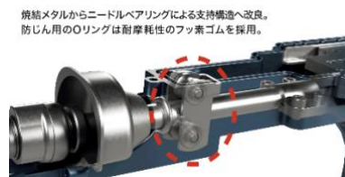
焼結メタルからニードルベアリングによる支持構造へ改良。 防じん用のOリングは耐摩耗性のフッ素ゴムを採用。

先端軸受け部をローラーにすることにより摩擦による摩耗・発熱が従来製品※より軽減され、軸受け部分の耐久性が向上しました。