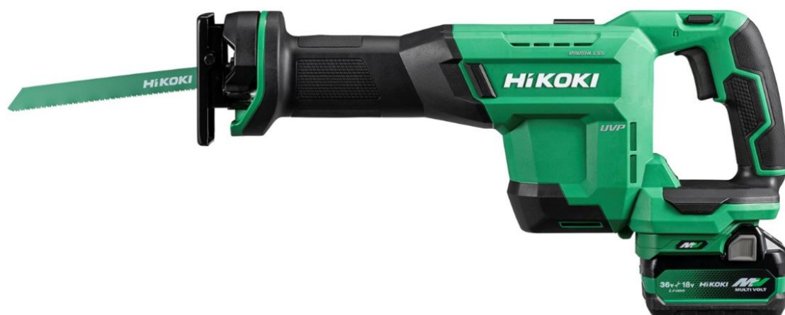
【コードレスセーバソーCR 36DSA】

電動・空気工具を販売する工機ホールディングスジャパン株式会社（本社：東京都港区、代表取締役 社長執行役員 吉田智彦 以下、工機ホールディングスジャパン）は、電動工具ブランド「HiKOKI(ハイコーキ)」から、36V コードレスセーバソーの新製品 CR 36DSA を 2026 年 2 月 20 日（金）より全国の電動工具取扱販売店などを通じて販売を開始します。